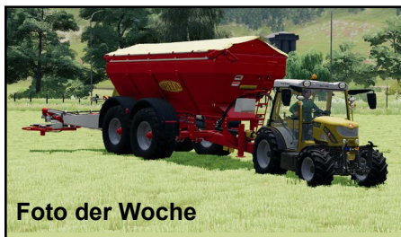
Foto der Woche